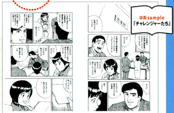
は漫画 sample 「チャレンジャーたち」